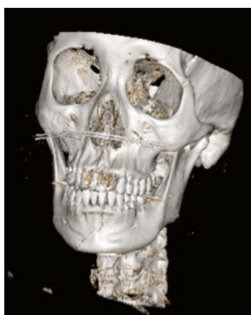
Reconstrucción tridimensional de escáner facial que muestra una fractura de mandíbula tras caída en patinete eléctrico

Los especialistas de Cirugía Maxilofacial añadimos la recomendación del uso de casco con protección facial.